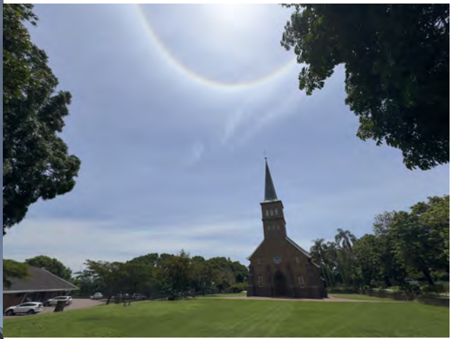
Eine seltene Sonnenerscheinung an unserem Himmel am 27.11.2025