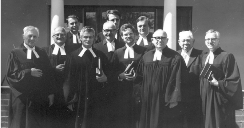
Diese Aufnahme ist nach der Ordination gemacht (vor der Veranda des alten Hauses).